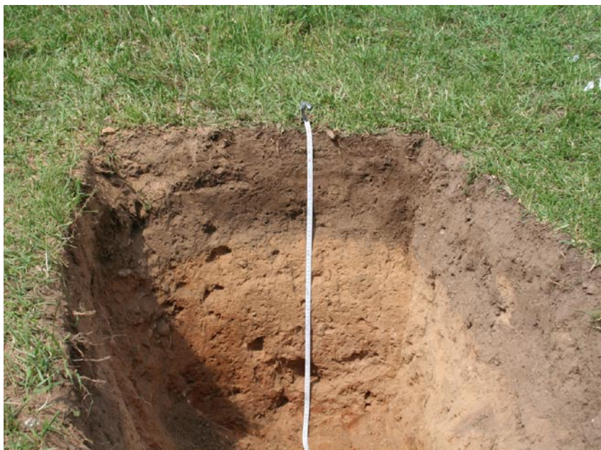
Fot. 5-6. Przykłady zróżnicowania typologicznego gleb w okolicach Kuźnicy. Phot. 5-6. Typological differentiation of the soils in the vicinity of Kuźnica.