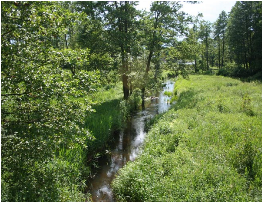
Fot. 7-8. Dolina i koryto Łosośnej w okolicach Chreptowic i Czuprynowa. Phot. 7-8. The valley of Łosośna River (Chreptowice i Czuprynowo environs).