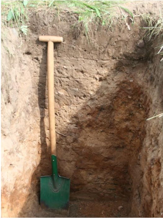
Fot. 3-4. Przykłady zróżnicowania typologicznego gleb w okolicach Kuźnicy. Phot. 3-4. Typological differentiation of the soils in the vicinity of Kuźnica.