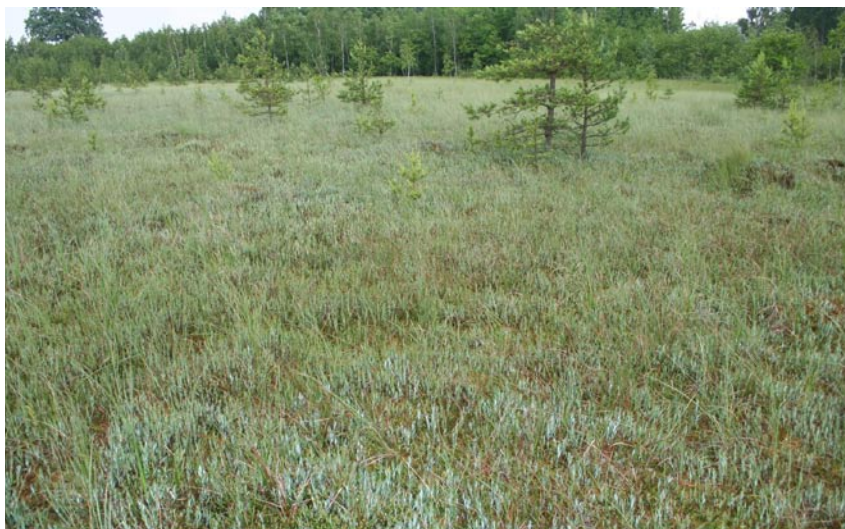
Fot. 13. Powierzchnia torfowiska Jeziorko zasiedlana przez kilkuletnie sosny.

Phot. 13. Central part of the Jeziorko peat bog colonized by young pine trees.