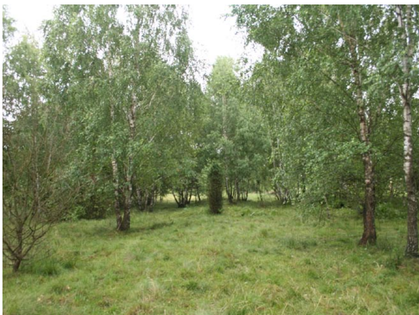
Fot. 14. Wał okalający torfowisko Jeziorko porośnięty lasem brzoźowym.

Phot. 13. Central part of the Jeziorko peat bog colonized by young pine trees.