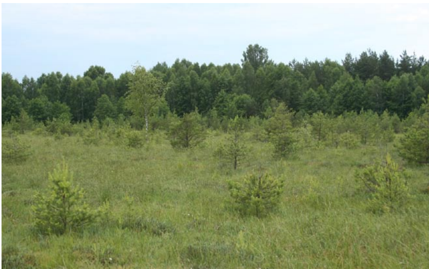
Fot. 12. Widok na środkową część torfowiska Jeziorko z samosiewkami sosen.

Phot. 11. A view for the embankment surrounding the Jeziorko peat bog.