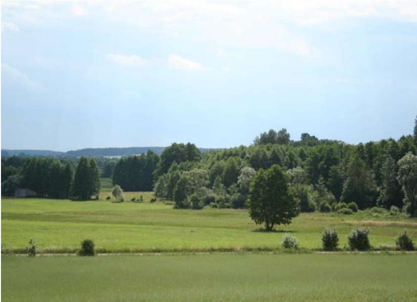
Fot. 9. Krajobraz Wzgórz Sokólskich w okolicach Kuźnicy. Phot. 9. The landscape of the Sokólskie Hills in Kuźnica environs.