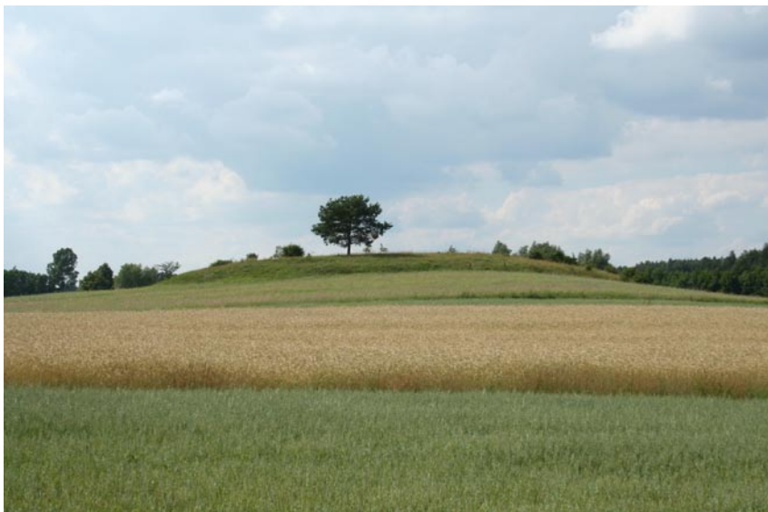
Fot. 10. Krajobraz równiny moreny dennej z morenami martwego lodu i formami szczelinowymi w okolicach Wolkusza Phot. 10. Morainic landscape in Wolkusz region.