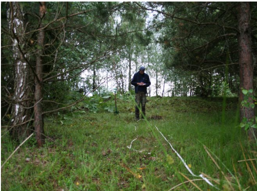
Fot. 11. Widok na wał okalający torfowisko Jeziorko.

Phot. 11. A view for the embankment surrounding the Jeziorko peat bog.