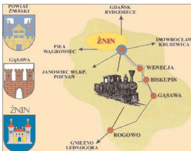
Ryc. 2. Trasy turystyczne Żnińskiej Kolei Powiatowej (Tourist tracks of Żnińska Kolej Powiatowa)