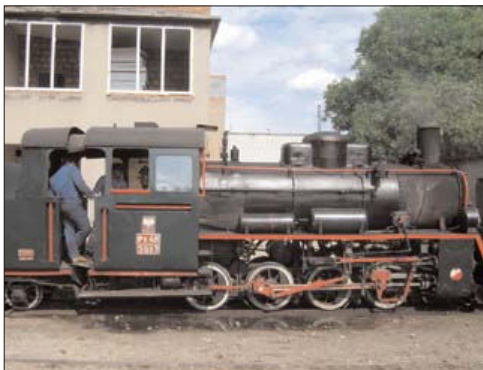
Fot. 1. Lokomotywa SM03 ( Locomotive SM03 )

Interesującymi pojazdami są drezyny ręczne i motorowe, a także pojazdy pomocnicze -odsnieżarki czy pojazdy do remontu torów. Duża część taboru wąskotorowego jest dzisiaj nieużywana, wiele pojazdów stało się zabytkami techniki rozlokowanymi w muzeach kolejnictwa na terenie całego kraju.