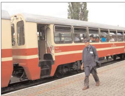
Fot. 3. Wagon osobowy MBxd ( Passenger car )