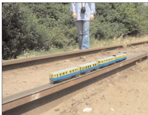
Fot. 4. Model pociągu ( Train model )