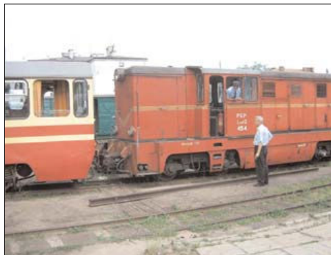
Fot. 2. Wagon Bxhpi ( Locomotive Bxhpi )