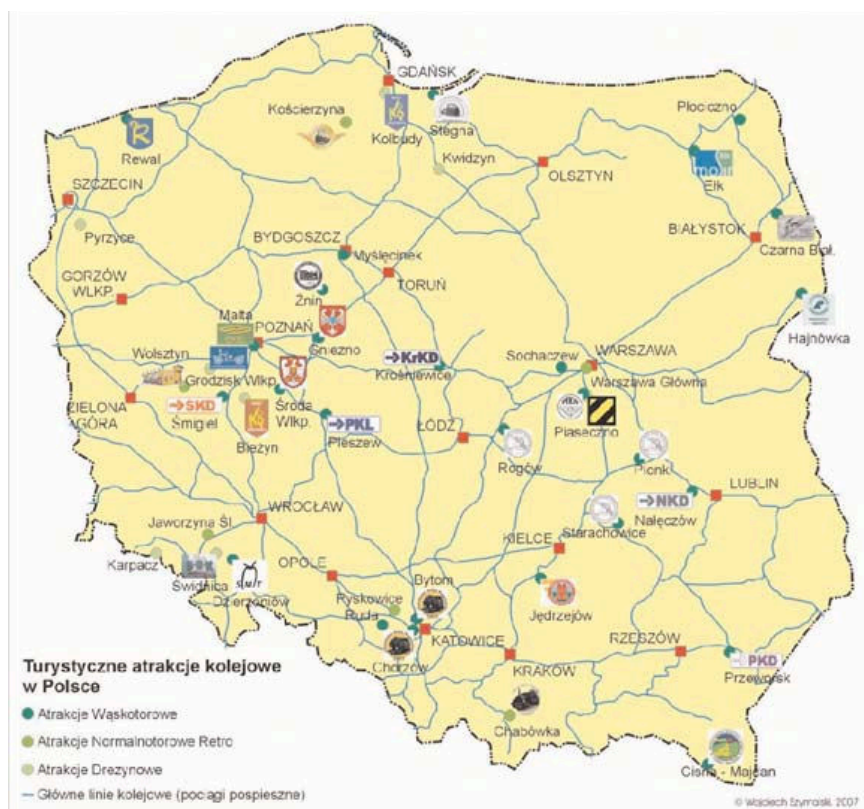
Ryc. 3. Turystyczne atrakcje kolejowe w Polsce (Touristic attraction of railway lines in Poland) (W. Szymalski 2007)

zerskie, drezyny ręczne i motorowe. Można także poznać infrastrukturę kolejową taką jak: zabytkowa poczekalnia, budka dróżnika ze zwrotnicami i rozjazdami, obrotnica, żuraw wodny. Zwiedzanie muzeum ułatwiają przewodnicy, można zakupić pamiątki i skorzystać z usług gastronomicznych.