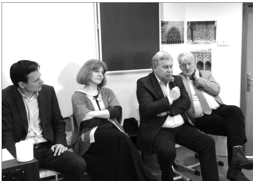
Jerzy Engel wśród panelistów

Chciałbym poruszyć jeszcze jedną sprawę. Z mojego osobistego doświadczenia wiem, że nigdy nie powinniśmy grać, udając kogoś innego. Gdybym udawał Górskiego, Piechniczka czy Strejlau'a, to i tak nie byłbym żadnym z nich. Albo jestem taki, jaki jestem i mnie przyjmiecie, moje zasady, mój sposób bycia, moją filozofię pracy, albo się nie dogadamy i nic z tego nie będzie. Ważne, aby być zawsze sobą. Tylko aktorstwo daje tę możliwość, że tam można być osobą, która gra tysiące ról. U nas obowiązuje zasada bycia sobą, oszukać można raz. Chciałbym, żeby te dwa krótkie przesłania pozostały po moim wystąpieniu.