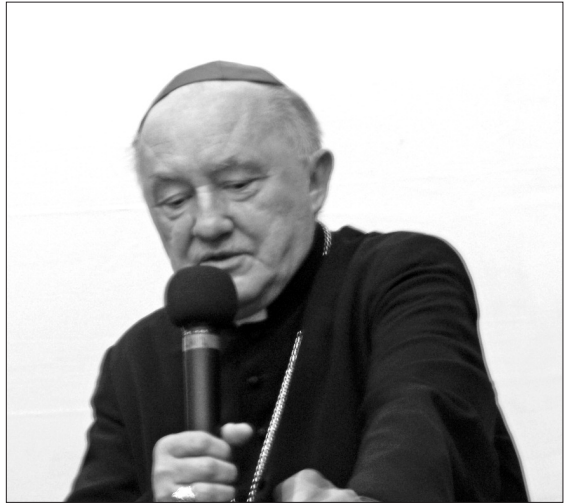
Ks. kardynał Kazimierz Nycz