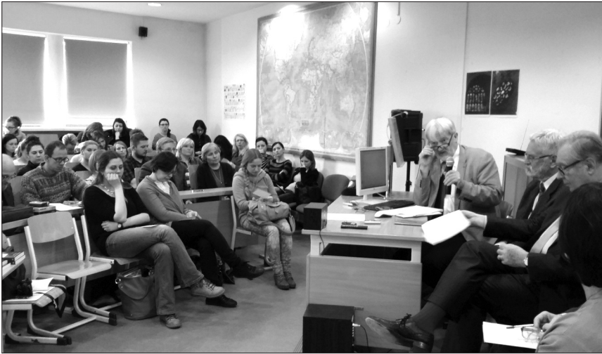
Paneliści i słuchacze