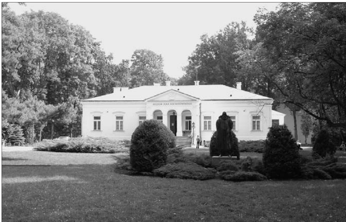
Fot. 1. Czarnolas

Czarnolas - wieś od XV wieku w rękach rodziny Kochanowskich (fot. 1). Nazwa wsi pochodzi od grądów jodłowych powszechnie nazywanych „czarnym lasem“. Jan Kochanowski zamieszkał w dworze czarnoleskim w 1571 roku i tu też powstały jego najśłynniejsze dzieła. Dworek Kochanowskich nie zachował się do naszych czasów. Według ustnych przekazów znajdował się w miejscu wzniesionej w latach 1826-1846 neogotyckiej kaplicy z grobowcami Jabłonowskich i Lubomirskich. W murowanym dworku, zbudowanym około 1870 roku dla Władysława Jabłonowskiego, mieści się bardzo interesujące