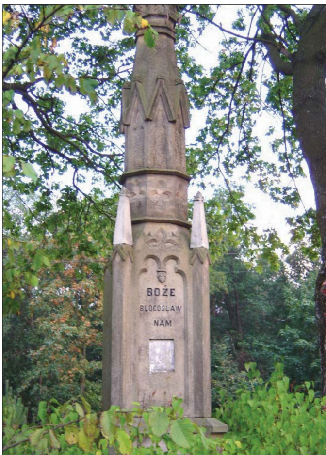
Fot. 4. Kapliczka w Kajzerówce z 1886 roku

złe, przychodziło z zewnątrz. Stąd między innymi krzyże na granicy tego świata - by chronić wioskę przed morowym powietrzem lub przed innym złem. Rozstaje dróg wpisują się w obraz takiej granicy - to droga do obcego świata. Geneza krzyży nagrobnych zawiera również element magicznego zabezpieczenia. Krzyże owe były nie tylko znakami sakralnymi, ale także barierą odcinającą drogę powrotu pochowanym pod nimi zmarłym (Kowalski, 1998). W wielu miejscach kontynuacją istniejącego dawniej krzyża jest postawiona na jego miejscu kapliczka. Drewniane krzyże wkopywano bezpośrednio do ziemi. Niczym niezabezpieczone drewno szybko próchniało. Gdy krzyż zaczynał się pochylać, odrąbywano i palono zniszczoną część, a krzyż wkopywano ponownie. Dlatego nie dziwiły krzyże bardzo ni-