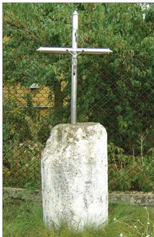
Fot. 6. Kamień milowy z czasów Jagiellonów ze współczesnym krzyżem w Pionkach