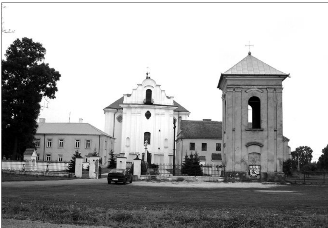
Fot. 3. Zespół klasztorny w Opactwie

twórni prochu. W Pionkach warto zobaczyć kościół parafialny p.w. Św. Barbary z 1929 roku, z barokowym ołtarzem oraz cmentarz z mogiłą żołnierzy walczących w I wojnie światowej.