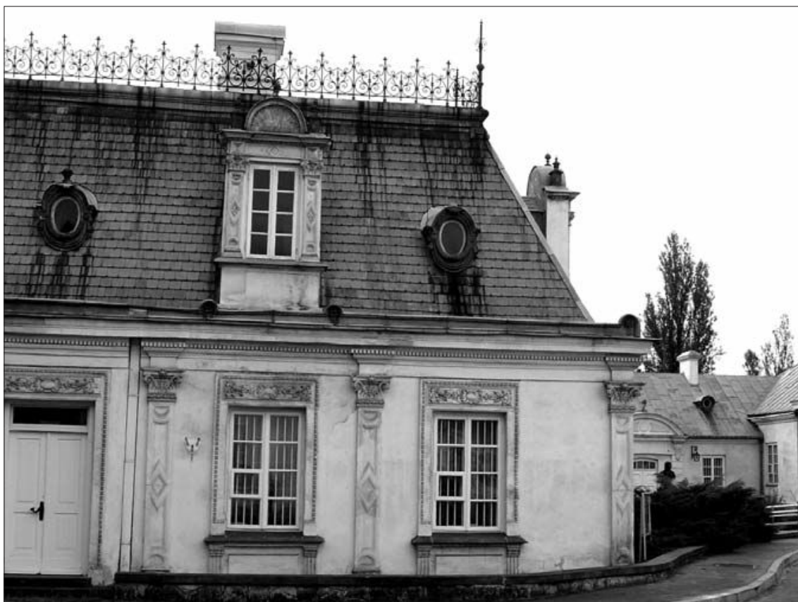
Fot. 2. Pałac w Kozienicach

Kozienice - miasto, w którym początki osadnictwa sięgają X wieku. Od XV wieku miasto królewskie i siedziba królewskich łowców. Tu w 1467 roku urodził się późniejszy król Polski Zygmunt Stary. Najważ-