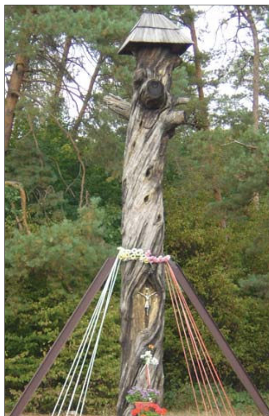
Fot. 8. Kapliczka na sośnie banca w Stanisławicach