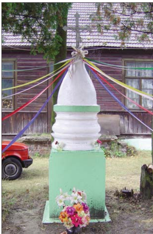
Fot. 5. Kapliczka w Pionkach o przekroju koła