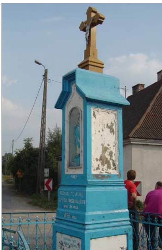
Fot. 7. Kapliczka w Sieciechowie z 1896 roku, na rozstajach dróg