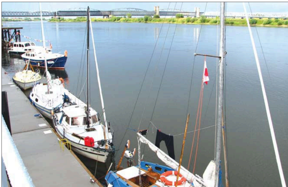
Fot. 8. Tczew – nowy, pływający pomost w nowej marinie Phot. 8. Tczew – a new, floating pier in a new marina