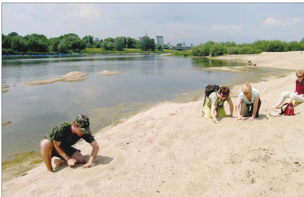
Fot. 11. Nauczyciele – słuchacze studiów podyplomowych „Przyroda” w Szkole Wyższej Przymierza Rodzin podczas geograficznych zajęć terenowych nad Wisłą w Warszawie (2007 r.)

Źródłem wiedzy na temat wartości takiej rzeki jak Wisła powinny być mass media (telewizja edukacyjna), ale tak niestety nie jest.