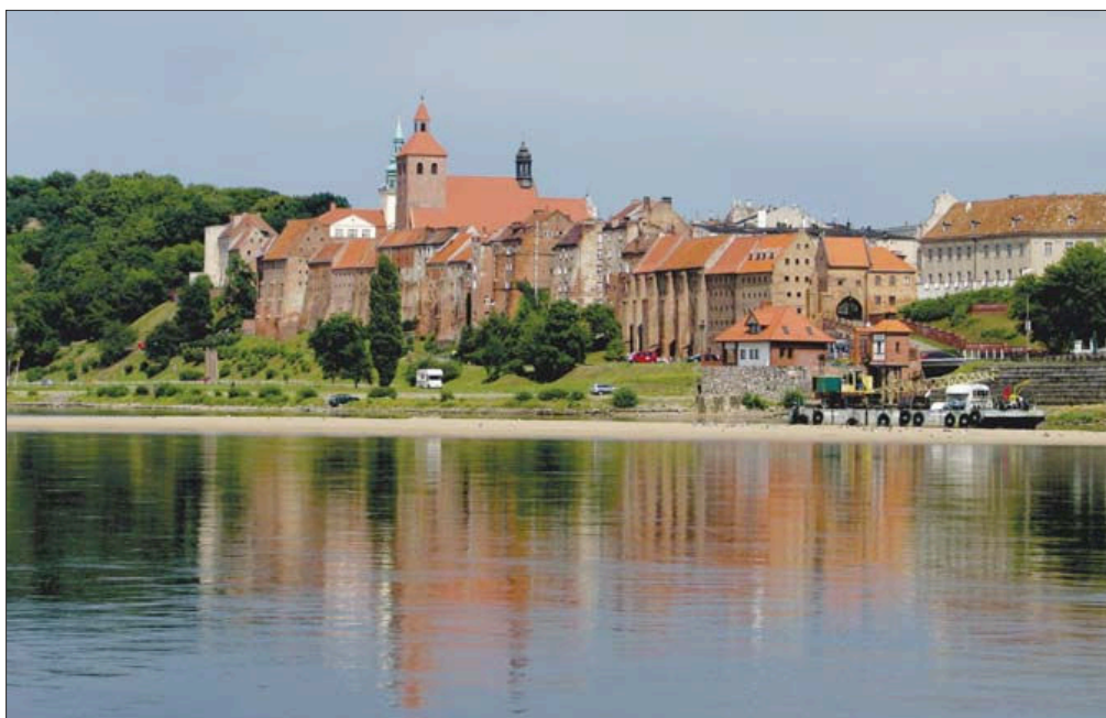
Fot. 5. Gotyckie spichrze w Grudziądzu – wartości kulturowe, świadczące o dawnych związkach miasta z Wisłą. Phot. 5. Gothic garners in Grudziądz – cultural assets bearing witness to the old ties of the town and the Vistula.