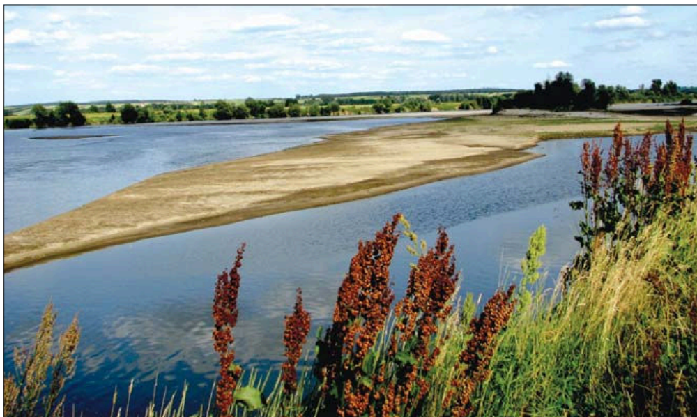
Fot. 1. Krajobrazy środkowej Wisły podczas niskich stanów wody w rzece Phot. 1. Landscapes of the central Vistula during low water levels (fot. J. Angiel)