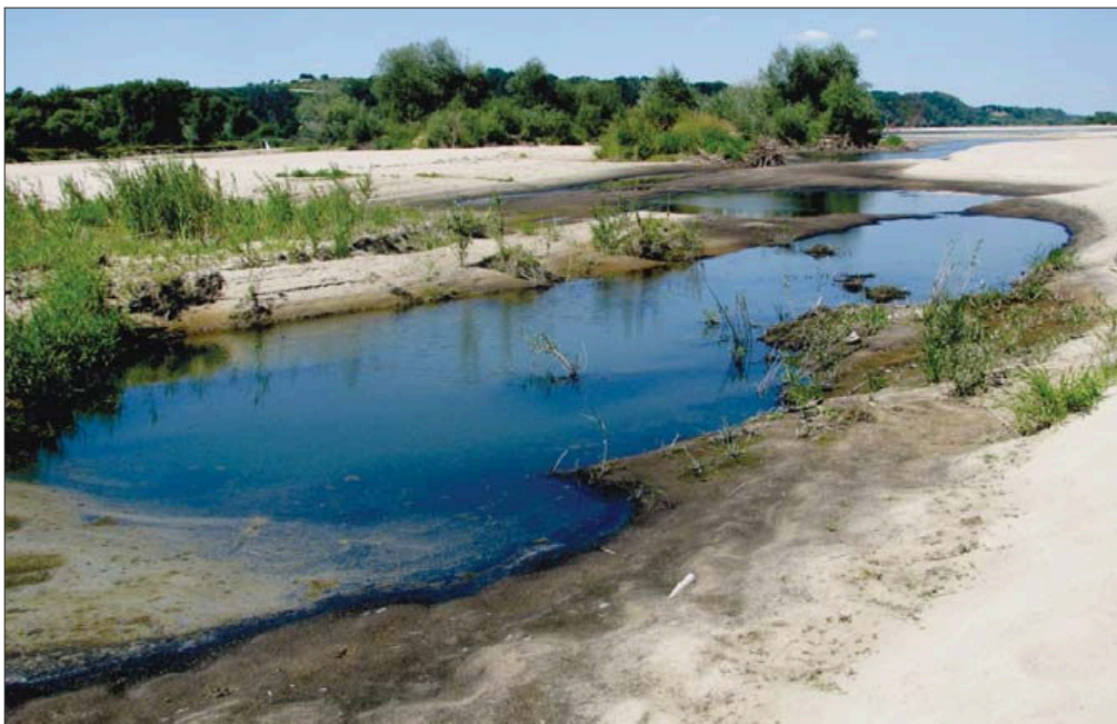
Fot. 4. Unikatowe wartości przyrodnicze Małopolskiego Przełomu Wisły Phot. 4. Unique natural assets of the Małopolska Vistula gate