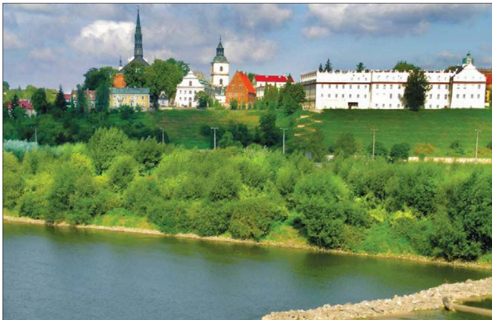
Fot. 3. Sandomierz - dziedzictwo kulturowe nadwiślańskiego miasta, powstałego dzięki Wiśle Phot. 3. Sandomierz - cultural heritage of a town, which was founded thanks to the Vistula

Przyrodnicze znaczenie i oddziaływanie rzeki nie ogranicza się do tego, co się dzieje w jej korycie w czasie najdłużej trwających niskich i średnich stanów wody. Sięga i ogarnia jej całą dolinę (np. podczas wysokich stanów wody zostają przemodelowane jej tarasy zalewowe, nanoszone osady rzeczne, odcinane starorzecza itp.), a nawet wykracza poza nią (rzeka oddziałuje np. na klimat lokalny).