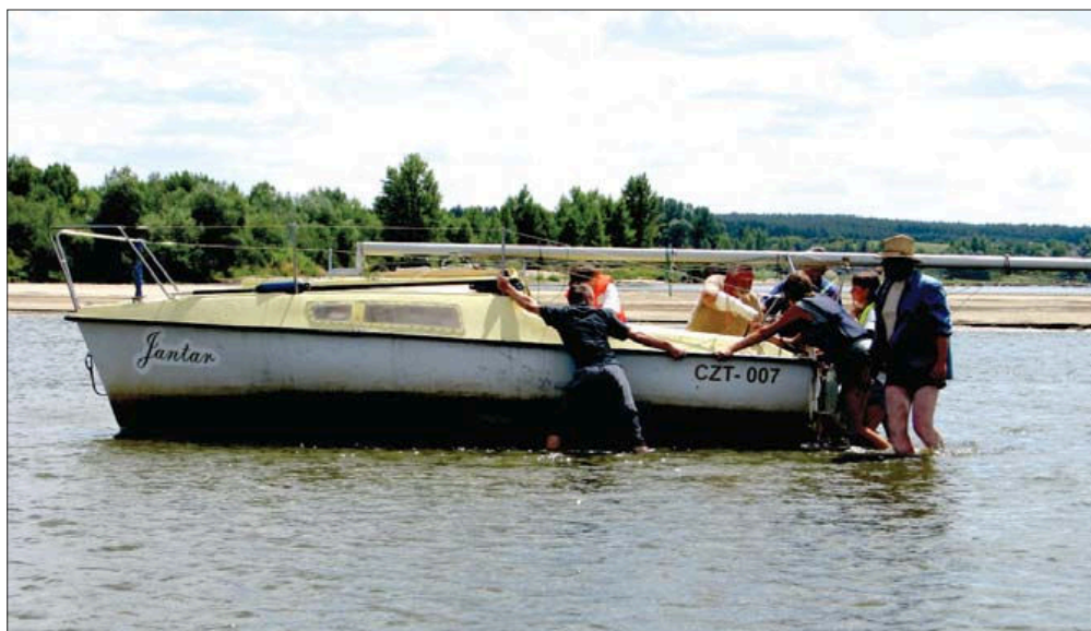
Fot. 10. Przykład „ekstremalnej” turystyki wodnej na Wiśle środkowej podczas niskich stanów wody.

Phot. 10. An example of an „extreme” aquatic tourism in the central Vistula during low water levels.