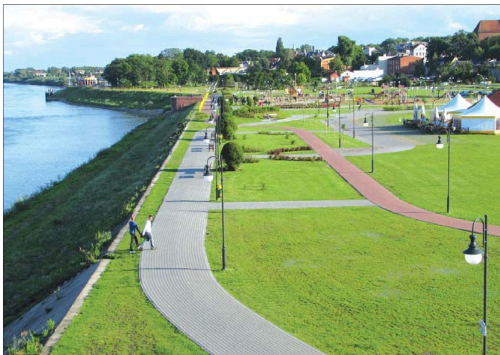
Fot. 7. Tczew – przykład pozytywnego zagospodarowania brzegu Wisły w mieście Phot. 7. Tczew – an example of a favourable Vistula bank management in a town