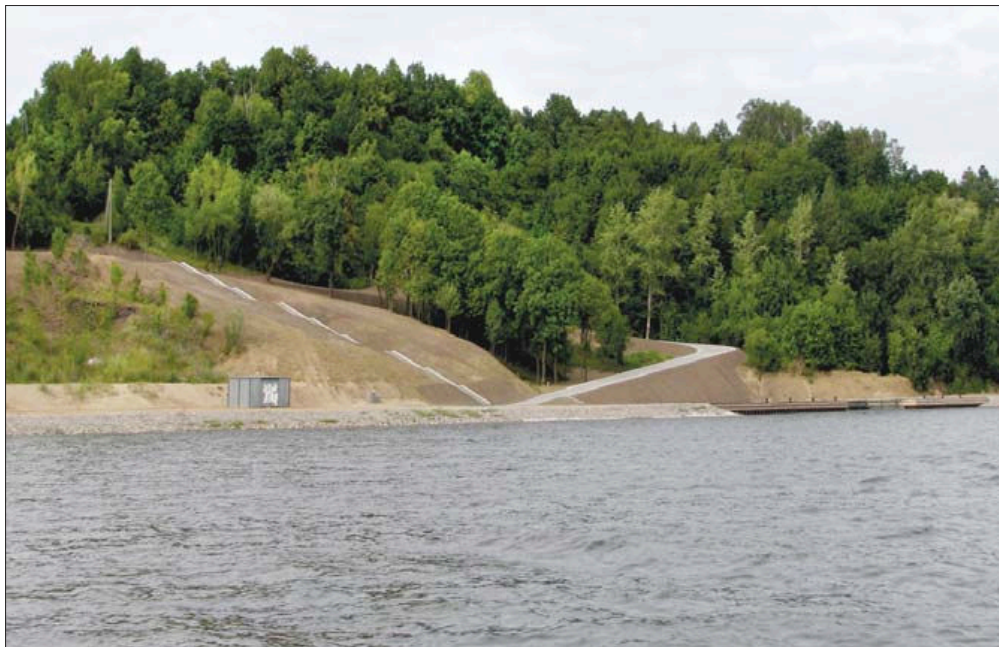
Fot. 9. Porządkowanie wiślanych brzegów i skarpy oraz budowa przystani w Dobrzyniu nad Wisłą (lipiec 2008 r.)